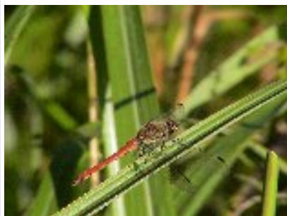
アキアカネ (トンボ科)

毎年南方から繁殖しながら北上するトンボで、梅雨の晴れ間に気流に乗って飄々と現れますが、ほとんど止まることが無く空に漂っています。しかし、秋には画像の様になぶら下がり状態で見られる個体が観察できます。羽化した頃のアキアカネを少し大きくしたようなトンボです。