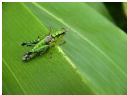
ミカドフキバッタ (バッタ科)

黒褐色で小型(体長25mm程度)のバッタでよく飛びます。屋や乾燥した草原に普通です。しかし、数回追いかけると疲労して飛べなくなります。雄は翅と後脚をすり合わせて「シュルシュル」と音を出します。雌は雄よりも少し大きく音は出しません。