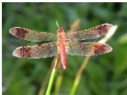
ミヤマアカネ (トンボ科)

最も普通に見られるアカトンボです。成虫の寿命は長い方で、初霜が観察される頃まで生きた成虫がいます。羽化するのは7月ですが夏の間山間地へ避暑移動していますので山へ行けばたくさんの黄色い未熟個体に遭遇できます。秋になれば成熟して腹部が赤くなった個体が続々と平地に移動して産卵します。