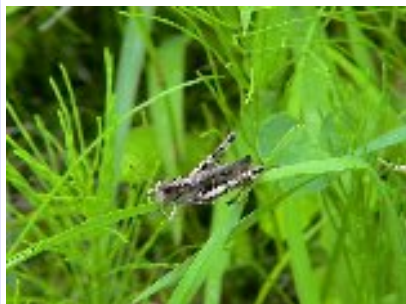
ヒナバッタ (バッタ科)

黒褐色で小型(体長25mm程度)のバッタでよく飛びます。屋や乾燥した草原に普通です。しかし、数回追いかけると疲労して飛べなくなります。雄は翅と後脚をすり合わせて「シュルシュル」と音を出します。雌は雄よりも少し大きく音は出しません。