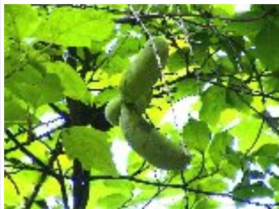
ミツバアケビ (アケビ科)

熟した実の形から古くは「開け実」と呼ばれたことから名付けられました。青森で見られるほとんどの「アケビ」は、「ミツバアケビ」です。「アケビ」の小葉は5枚ですが、本種は3枚です。実を食用とするほか、蔓をかご細工などに利用され、茎は生薬としても用いられます。