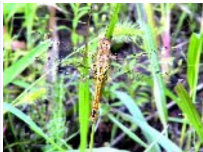
ウスバキトンボ (トンボ科)

毎年南方から繁殖しながら北上するトンボで、梅雨の晴れ間に気流に乗って飄々と現れますが、ほとんど止まることが無く空に漂っています。しかし、秋には画像の様になぶら下がり状態で見られる個体が観察できます。羽化した頃のアキアカネを少し大きくしたようなトンボです。