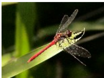
マユタテアカネ (トンボ科)

平地よりは低山地のトンボで、森の広場でもわずかに飛来していたのを見えています。翅には横褐色の帯模様があり(未成熟個体)縁紋はアキアカネなどでは黒色なのに対し黄色で大きく、性熟した雄の腹部ほか縁紋翅脈も赤くなって美しいトンボです。大きさはアキアカネとほぼ同じです。