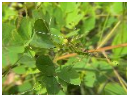
アシグロツユムシ (キリギリス科)

体は緑色で翅は痕跡的な小さな褐色の小片がペタッと付いているだけです。ハネナガフキバッタの翅が無くなったような体形です。後脚腿節下面が赤いのでよく目立ちます。クズの葉上などにいます。秋には裸地に出てきて土中腹部を挿しこんで産卵する♀個体を見かけます。