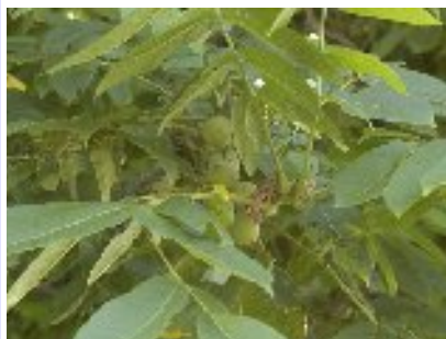
オニグルミ (クルミ科)

全国各地に生え、雌雄異株です。春に黄緑色の小さな花を多数つけて、実は秋に淡褐色に熟します。果実の表面には短い剛毛があります。樹液に触れるとウルシかぶれをおこしますので、注意が必要です。