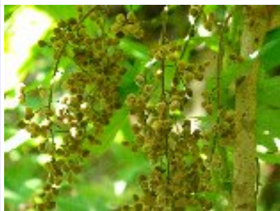
ヤマウルシ (ウルシ科)

葉軸に翼(軸に付属する扁平な突起物)があるので分かりやすいです。夏の終わり頃白い花をたくさんつけます。実は秋に赤く熟します。(写真は若い果実)まれにウルシかぶれをおこす場合がありますので、過敏な人は注意が必要です。