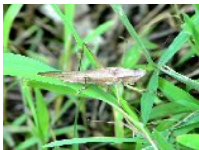
ヒメクサキリ (キリギリス科)

翅が長く身軽に藪の上を飛び回ります。脚が黒っぽいのが特徴です。森の広場では遊歩道周辺の藪で普通に見られるツユムシです。近似種にツユムシ、エゾツユムシ、セスジツユムシなどがあります。鳴き方は葉っぱの上を歩きながら「ジチキッ、ジチキッ、…、…」と断続的に低い音で鳴きますので聞き取りにくい様です。