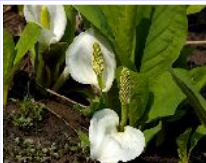
ミズバショウ (サトイモ科)

森の広場では、4月下旬～5月上旬に咲く。調整池の上流の沢沿いに見事な群落を作っている。白く目立つ部分は仏炎苞(ぶつえんぼう)と呼ばれる花を保護する役割をはたす部分で、中心の黄色い部分が本当の花になる。