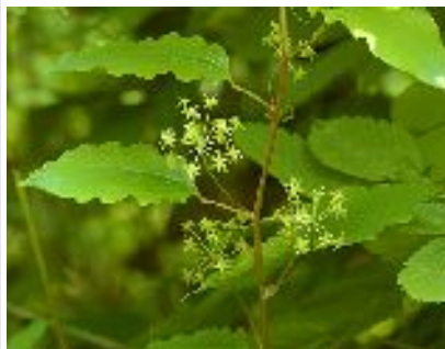
タチシオデ (ユリ科)

大きな3枚の葉が輪生し、褐色の3枚の花びらをもつ花がその中央に着く。カタクリと同じ頃に開花する。この植物も開花まで十数年かかるそうだ。カタクリと同様、森の広場では数が少ないようだ。