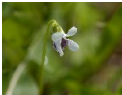
ツボスマレ (スマレ科)

全国各地の早春にごく普通に見られるすみれ。よく似たオオタチツボスマレとは、距が紫色を帯びる事で区別ができる。ただし、分布が広く生育環境の変化も大きいので、個体変異も多く、変種・品種や近縁種との区別がつけにくい場合がある。