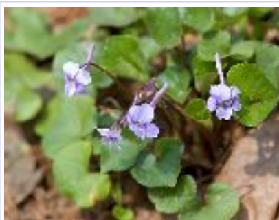
ナガハシスマレ (スマレ科)

長い距が特徴で別名テングスマレ。区別が付けにくいすみれのなかまの中では分かり易い。森の広場では四月～五月に林下で良く見られる。高さ十数cm程度。