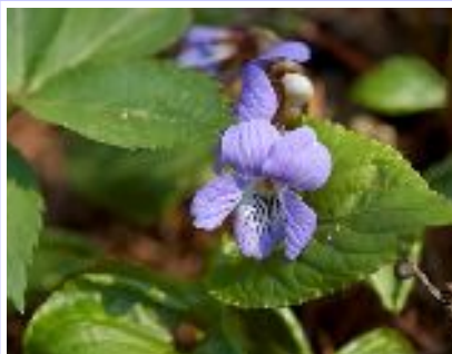
スマレサイシン (スマレ科)

長い距が特徴で別名テングスマレ。区別が付けにくいすみれのなかまの中では分かり易い。森の広場では四月～五月に林下で良く見られる。高さ十数cm程度。