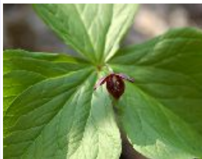
エンレイソウ (ユリ科)

浅虫の湯の島などで有名な早春を代表する花の一つ。種子が地面に落ちてから開花するまで8年くらいの時間がかかるそうだ。また、花の後に地上部が枯れて、一年の大半を球根のまま休眠する。森の広場でも観察できますが、数はあまり多くないようだ。