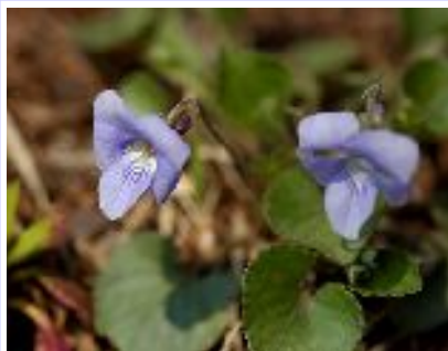
タチツボスマレ (スマレ科)

スマレのなかまでは大型で、花も葉も大きいので区別が付きやすい。森の広場での生育地は限られているようだ。花の色が白いシロバナスマレサイシンも同所に混在していた。